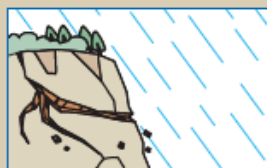
がけに亀裂が入る。がけから小石が落ちてくる。