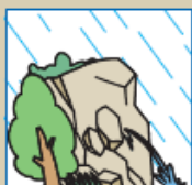
湧き水の量が増えてきた。