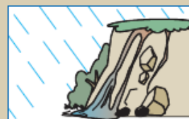
がけから出る水が濁る。