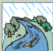
川が濁ったり、流木が混ざり始める。