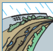
雨が降り続けているのに川の水位が下がる。